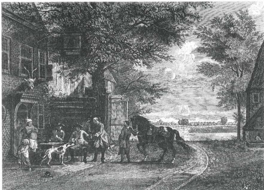
De herberg 'Het Bokje' in De Hout.