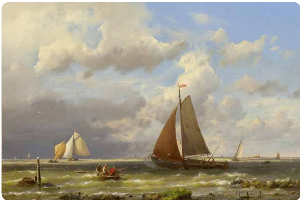
H. Koekkoek, Schepen op woelige zee, olie op doek 33 x 48 cm, gesigneerd en geda-teerd '62, Collectie Simonis & Buunk, Ede