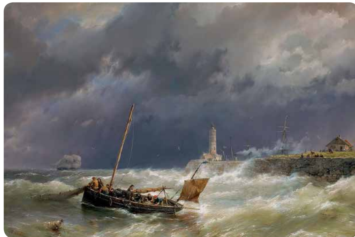
H. Koekkoek, Het binnenhalen van de netten bij stormachtig weer, olie op doek 67 x 101 cm, gesigneerd. Collectie Simonis & Buunk, Ede

aanklacht in. Wat was er precies gebeurd? Uit het vonnis van de rechtbank blijkt dat de echtgenote zulke onaangename opmerkingen en verwijten naar haar man had gemaakt, dat hij buiten zinnen van woede was geraakt. Helaas staat niet in het vonnis vermeld wát de vrouw precies gezegd had. Voor dit wangedrag kon de rechter een gevangenisstraf geven van maximaal twee jaar, plus een boete van maximaal honderd gulden. De rechter merkte echter op dat 'de onaangename bejegeningen' van mevrouw Koekkoek als verzachtende omstandigheid werden aangemerkt. In de aanklacht werd niet meegenomen dat zij ruim vijf