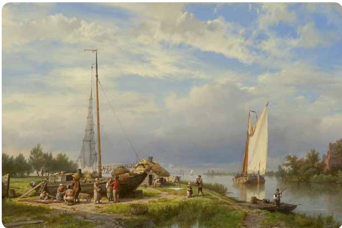
H. Koekkoek, Langs de rivier op een zomerse dag , olie op doek 37 x 58 cm, gesigineerd. Collectie Simonis & Buunk, Ede

vroeg H. Koekkoek voor een doek fl 3000,-. Terwijl andere schilders zoals J.H. Weissenbruch en Ch. Leickert hun stadsgezichten en landschappen voor fl 500,- en fl 600,- aan de man brachten. Uit deze prijsverschillen blijkt de grote populariteit van Hermanus Koekkoek. vi In 1873 verhuisde hij met zijn gezin naar Amsterdam; uit de kiezerslijsten voor de verkiezing van gemeenteraadsleden van Amsterdam blijkt dat hij voldoende geld verdiende om als stemgerech-