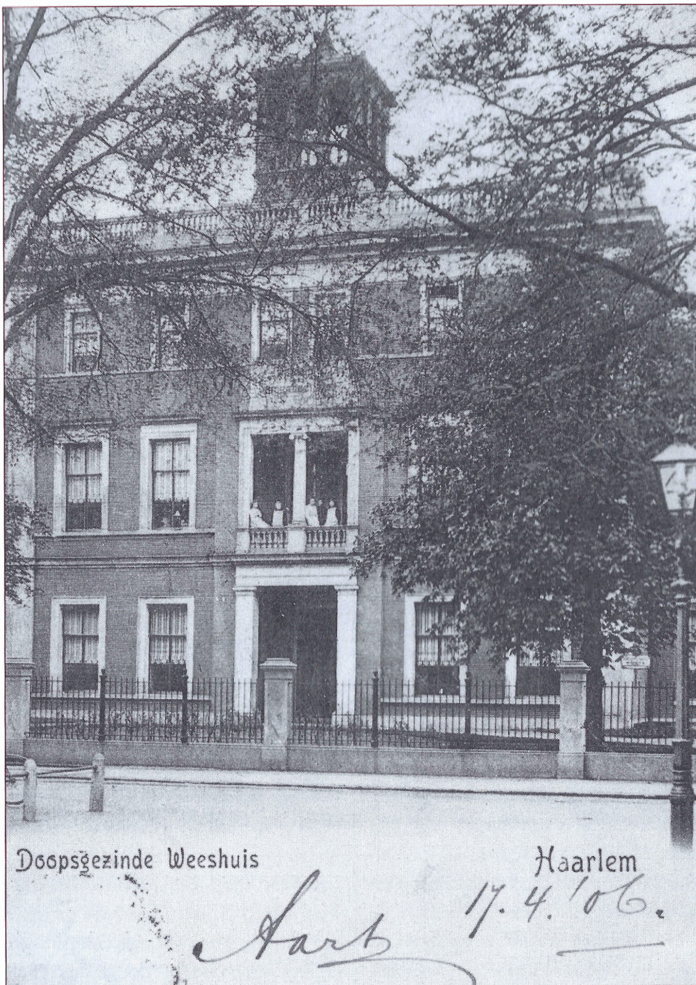
Vooraanzicht van het doopsgezichte weeshuis in 1906.

In het midden van het gebouw was een grote eetzaal, waar de kinderen met de vader en de moeder de maaltijd nuttigden. Hier is nu de ontvangsthuis van het archief met de receptie. Links naast de voordeur was de huiskamer van de vader en de moeder. Dit is nu de entree van het archief. Rechts naast de voordeur was een kleine salon. Direct links (aan de zuidkant) van de eetzaal waren twee kamers: een leerkamer waar het huiswerk gemaakt werd en een jongenskamer. Deze twee kamers zijn nu één ruimte geworden, die als kantine van het archief in gebruik is genomen. Rechts (aan de noordkant) waren een grote keuken, bijkeuken en provisiekamer. Deze ruimte is nu in gebruik als kamer van de medewerkers van de notariële index. In de rechtereuleugel lag aan de voorkant de naaikamer met daarachter de linnenkamer. In de naaikamer mochten in principe alleen de naaister, de moeder en de meisjes komen. Van deze twee vertrekken zijn na de verbouwing drie kamers gemaakt, die momenteel worden verhuurd.