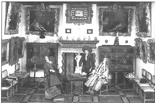
De zogenaamde kunstkamer met schilderijen uit het poppenhuis van Petronella de la Court in het Centraal Museum Utrecht.

De schrijvers vroegen zich af of de zeventiende-eeuwse genreschilderijen wel een betrouwbare bron waren voor dit onderzoek en vergeleken deze met de beschrijvingen in de boedelinventarissen. Uit een vergelijkend onderzoek blijkt hen dat de schilderijen van Vermeer en De Hooch bijvoorbeeld niet altijd een goede voorstelling van de werkelijkheid hebben gegeven. Zo komen op een groot aantal schilderijen voorwerpen voor die niet of nauwelijks in de boedelinventarissen te vinden zijn. Omgekeerd worden vele gebruiksvoorwerpen opgesomd in de archiefstukken die niet op de schilderijen staan afgebeeld. Anders is het met de zeventiende-eeuwse poppenhuizen die van een aantal welgestelde dames bewaard zijn gebleven. Deze zijn