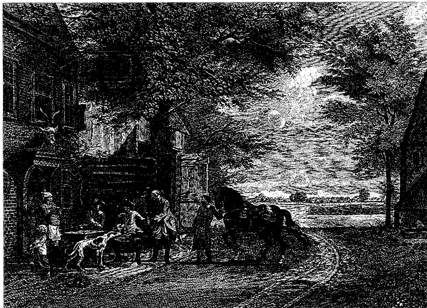
De herberg 'Het Bokje' in De Hout.