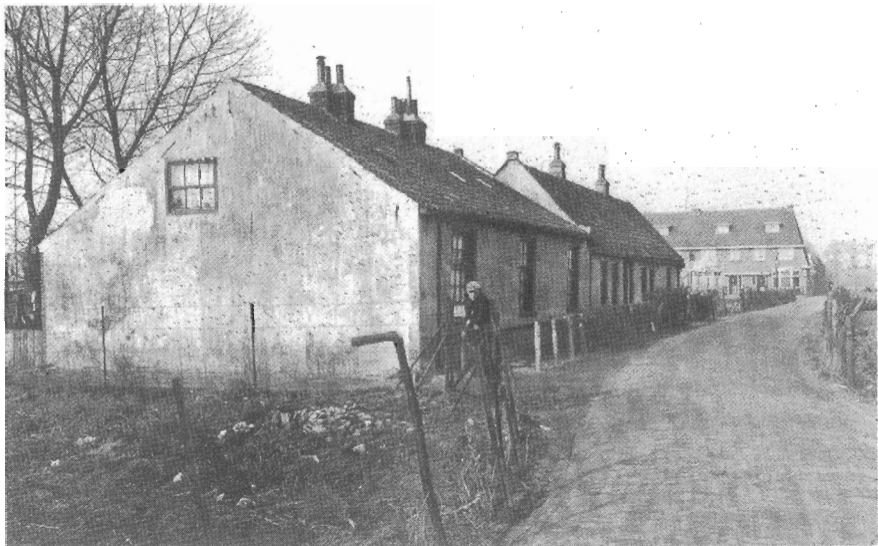
Deel van de Molenwerflaan omstreeks 1930