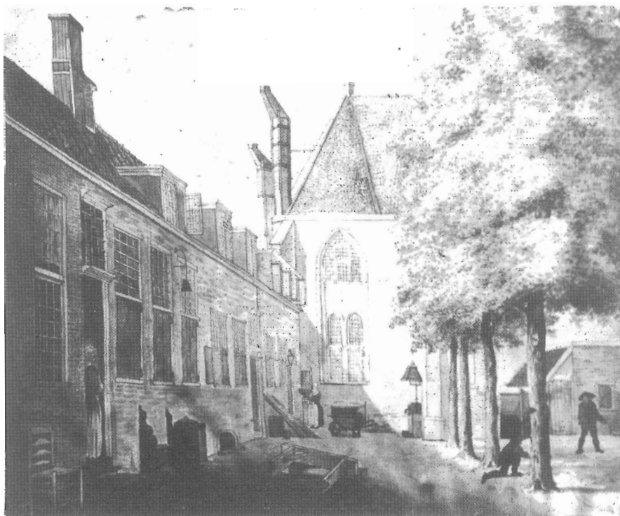
Binnenplaats van het armenhuis, voorheen arme kinderkuis aan de Magdalenstraat/Kinderhuisvest te Haarlem. Gezien naar het zuiden met de Magdalenakapel. Tekening uit ca 1770