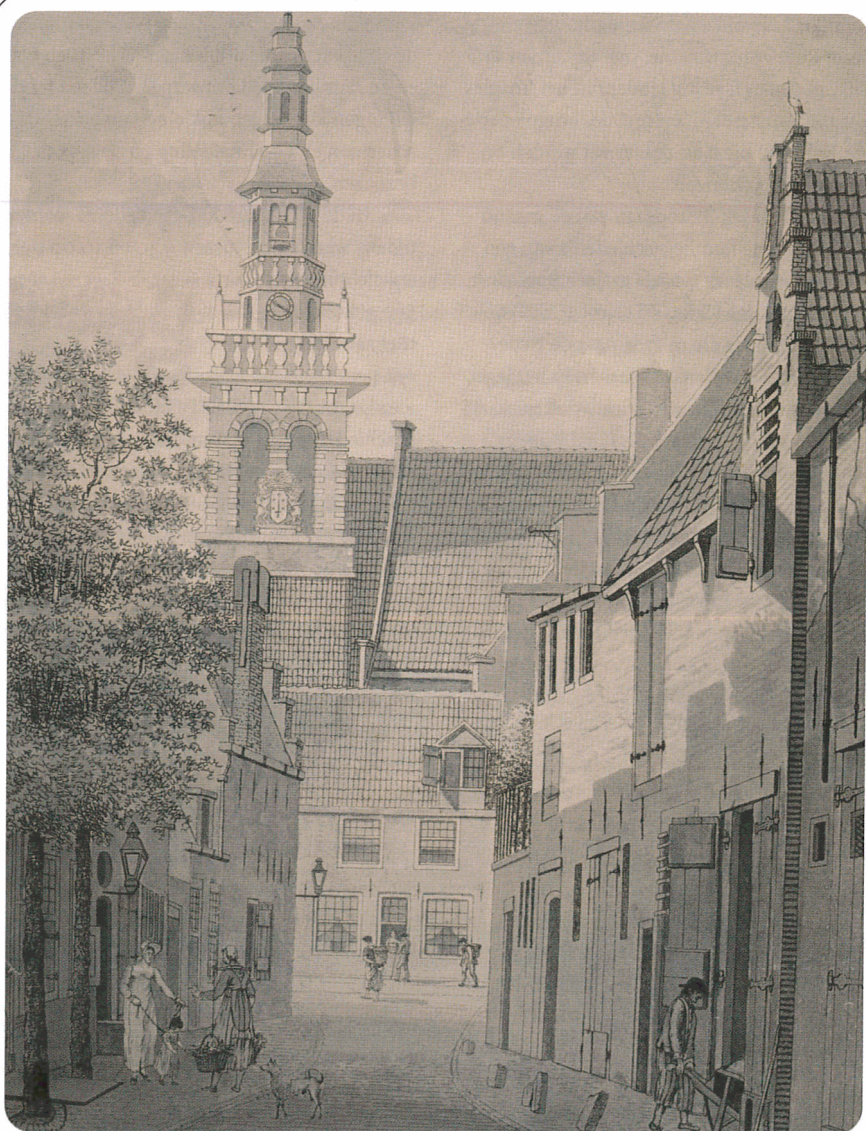
Straatleven in Haarlem (Witte Heerensteeg en Zijklooster), 1818 (gravure van W. Nieuwhof en J. Pannebakker; coll. Provinciale Atlas Noord-Holland, Rijksarchief in Noord-Holland)

Voor de berechting van misdrijven werden de hoven van assisen ingesteld. De rechtbanken van eerste aanleg behandelden beroepszaken van lagere rechtbanken, civielrechtelijke zaken als echtscheidingen en geschillen en misdrijven waarop maximaal vijf jaar gevangenisstraf stond, zoals diefstal, mishandeling en bedelarij. Op het laagste niveau stelde men rechtbanken van politie en vrede-