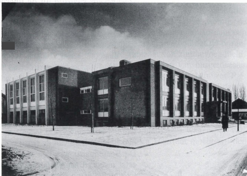
Afb. 28. Nieuw politiebureau aan de Cruquiusweg