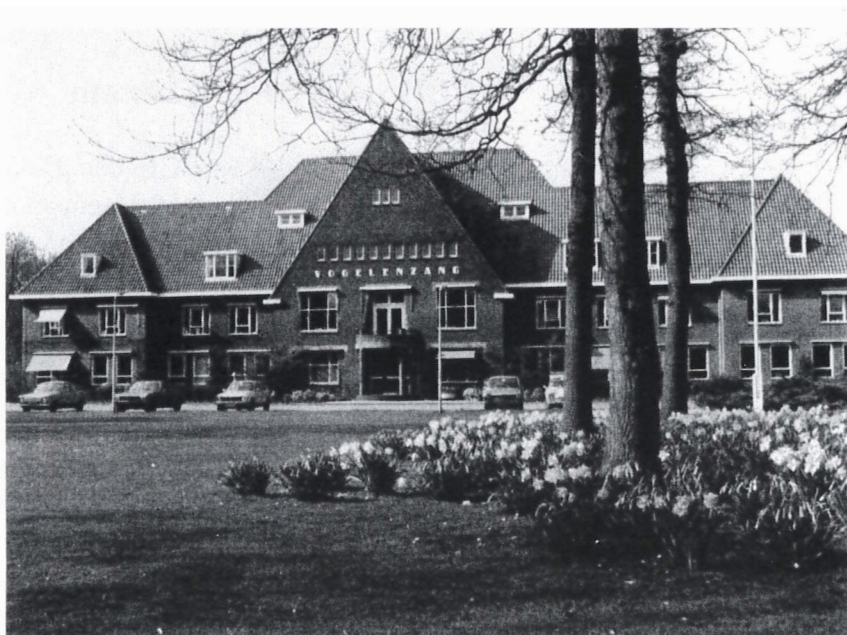
Afb. 21. Vooraanzicht 'Vogelenzang'

Het psychiatrisch ziekenhuis 'Vogelenzang' te Bennebroek kreeg in 1961 twee nieuwe gebouwen op haar terrein voor de behandeling, verzorging en ontspanning van haar 800 patiënten. Het gebouw voor bewegingstherapie bevatte een zaal met balcon, toneel, kleedkamers en een foyer. Het gebouw kan voor bewegingstherapie, concerten en toneelvoorstellingen gebruikt worden. Het tweede gebouw is een gebouw voor arbeidstherapie. Er zijn vier werkruimten voor 100 patiënten. Men hoopte dat door de contacten met verschillende bedrijven, voor welke men werkzaamheden uitvoerde, de band met de samenleving gedeeltelijk kon worden hersteld.