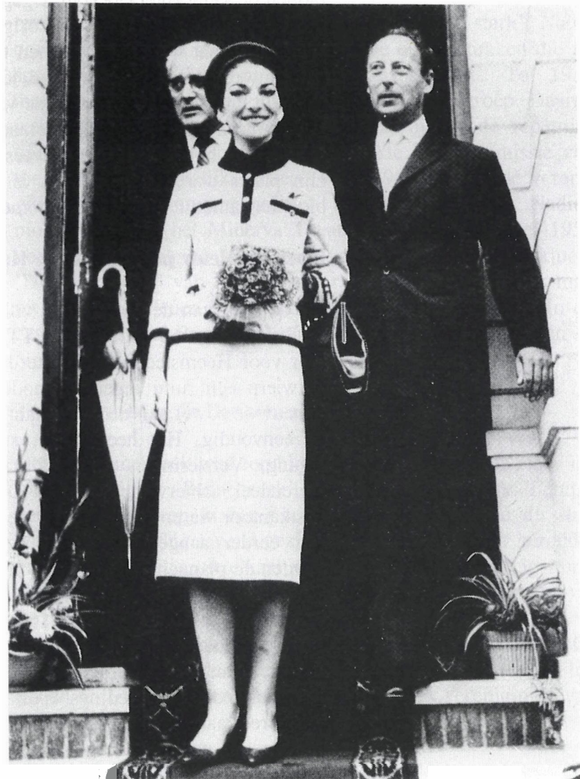
Afb. 20. Bezoek operadiva Maria Callas aan Heemstede