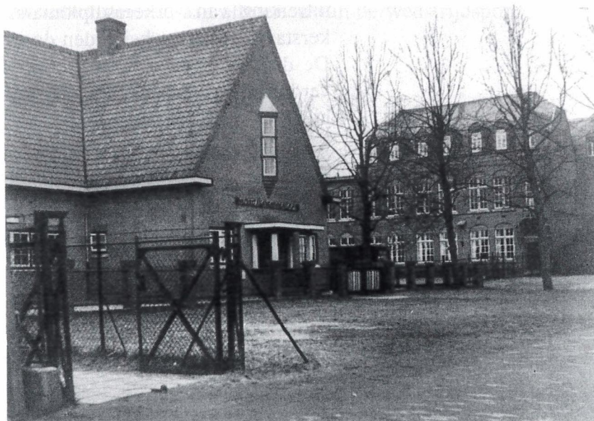
Afb. 26. De Sint Franciscusschool en het Sint Luciaklooster

De leerlingen van de katholieke huishoudschool te Bennebroek hielden elk jaar een modeshow van zelf vervaardigde kleding. Nachtjaponnen, mantelpakjes en nog veel meer wat een 'hedendaags' meisje kon dragen werden geshowd. De directrice zuster