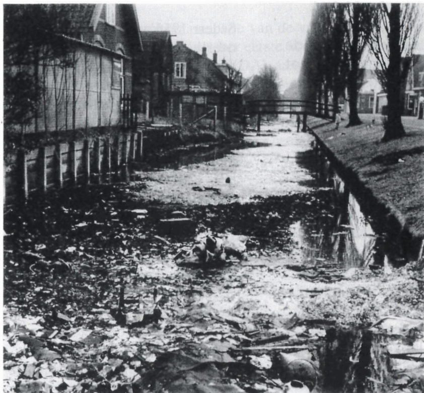
Afb. 24. Een blik op de Blekersvaart