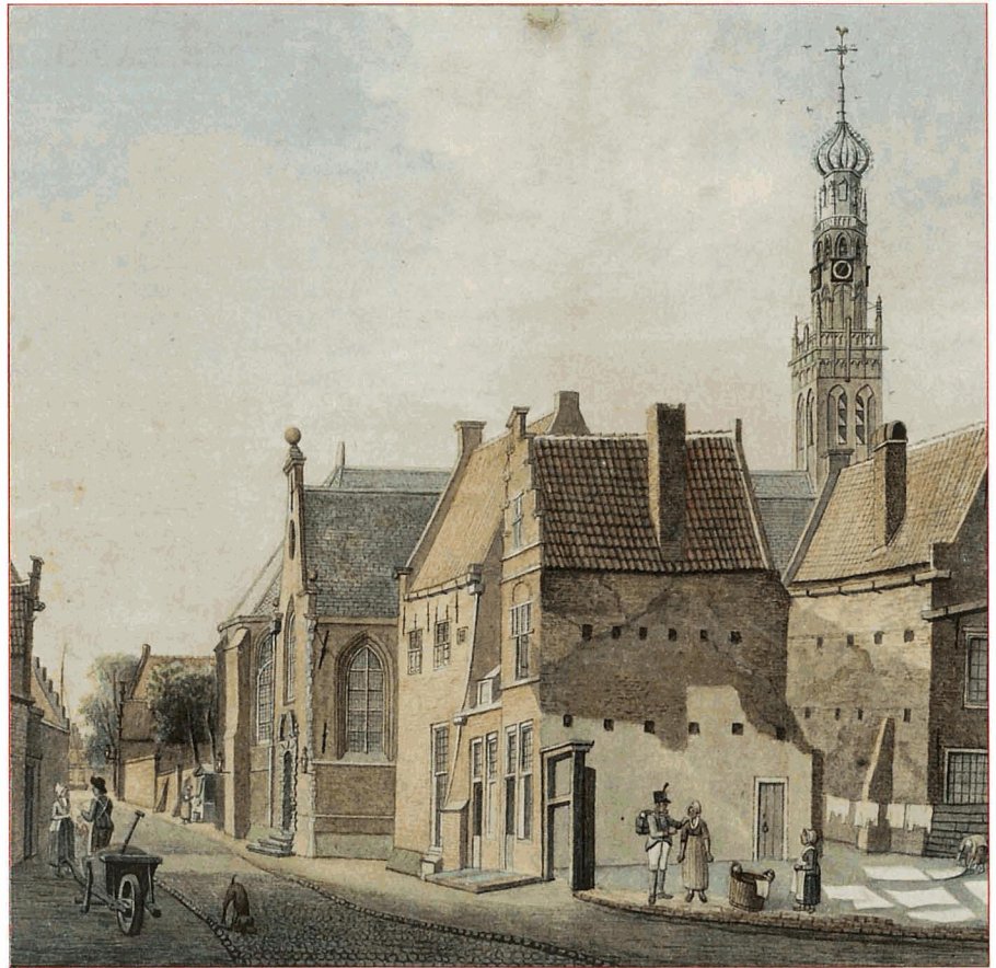
De Bakenesserkerk. Aquarel door Jan Pannenbakker uit 1816.

De zakelijke geschillen gingen meestal over bezitsvorderingen, leveranties die niet betaald waren of loongeschillen tussen werkgever en werknemer. Ook behandelde de vrederechter familiezaken, zoals voogdij over minderjarige kinderen of het onder curatele stellen van dronkaards en geestes-zieke familieleden. Een enkele keer stelde de vrederechter onderhoudsgeld van ex-echtgenoten vast. Tevens stelde hij akten van bekendheid op voor mensen die geen doopbewijs van zichzelf konden geven of een bewijs van overlijden van hun ouders. Het kwam ook voor dat fouten in namen in een akte van bekendheid voor de vrederechter gecorrigeerd werden. Ook zorgden vrede-rechters voor verzegeling van boedels bij overlijden of bij een faillissement en stelden zij boedelinventarissen op van kleine nalatenschappen. Taxateurs van goederen en inboedels moesten voor de vrederechter beëdigd worden. Ook stelde de vrederechter de akten van emancipatie op, waarbij minderjarigen handelingsbekwaam werden verklaard. Een enkele keer werd de vrede-