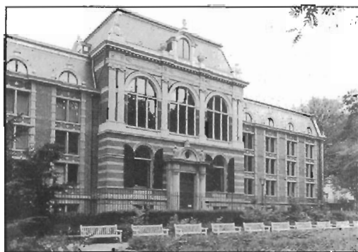
Het Koninklijk Huisarchief, in 1898 in gebruik genomen