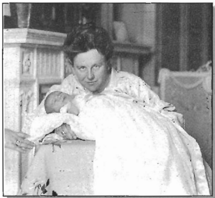
Wilhelmina met baby Juliana.