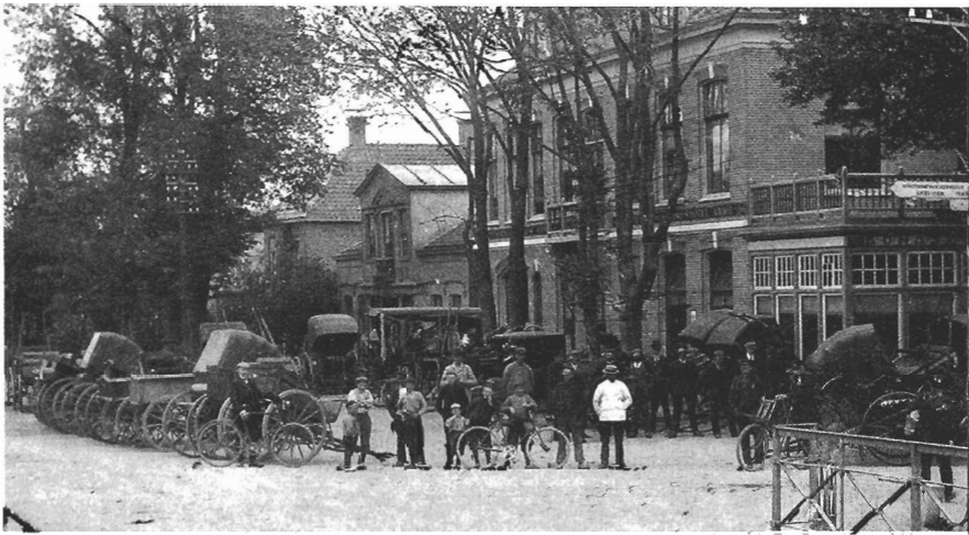
In Hoofddorp is het Marktplein het centrum van het dorp. Het was er altijd een gezellige drukte met veel mensen, paard en wagens, fietsers en in 1908 nog geen auto's. Deze briefkaart met Café De Beurs bevindt zich in de collectie prentbriefkaarten van de Provinciale atlas van Noord-Holland van het Noord-Hollands archief te Haarlem, nr 118.