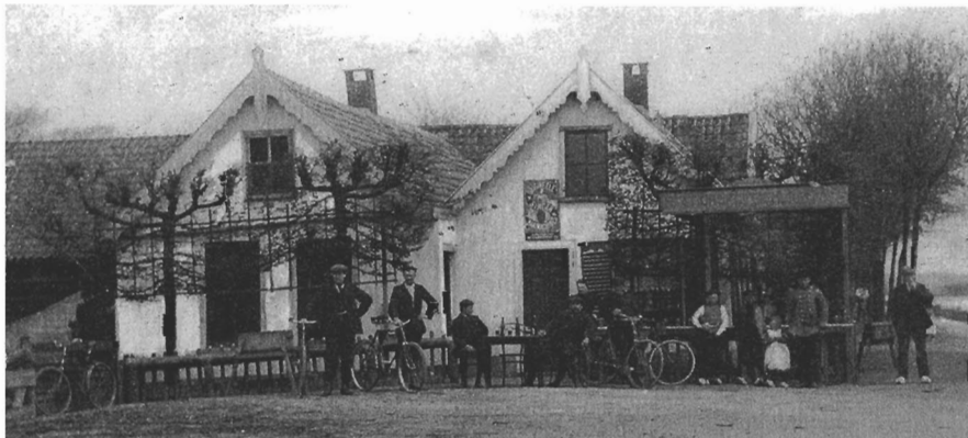
In beginjaren waren er in de Haarlemmermeer al veel cafe's, die druk bezocht werden. Er wordt wel gezegd dat er eerder cafe's waren dan een bakker en een slager. Op de gevel van het cafe staat een reclamebord van Singernaaimachines. Haarlemmermeer, Ringdijk-Vijfhuizerweg in 1902. Collectie prentbriefkaarten Provinciale Atlas Noord-Holland, Haarlemmermeer nr 44.