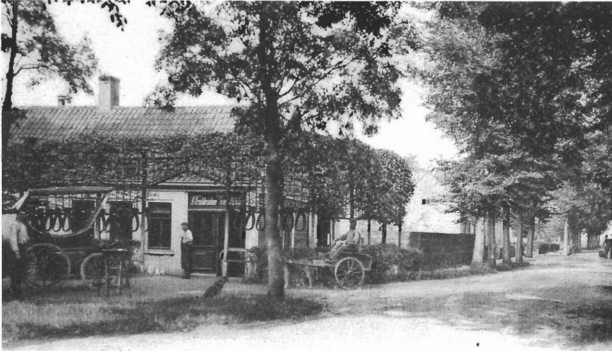
Een foto van de Kruisweg te Hoofddorp. Op de deur staat de naam geschilderd R. Krabbendam. Rechts is een man die wordt voortgetrokken door een hondenkar. De hondenkar is een typisch Nederlands vervoermiddel, dat ook in de Haarlemmermeer tot ca 1938 werd gebruikt om spullen te vervoeren.