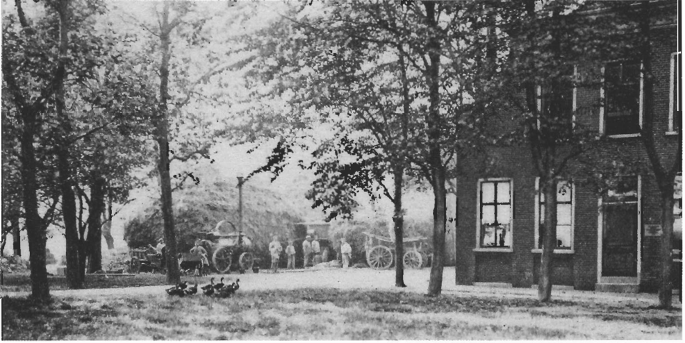
Boerderij Buitenrust in de Haarlemmermeer midden in de zomer. Op de achtergrond is een stoomdorsmachine te zien.