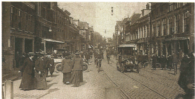
1906: Zuidkant Grote Houtstraat.