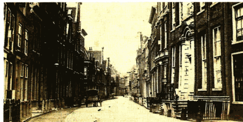
1865: de oudste foto van de Grote Houtstraat in het archief.

Quest is een mooi hip woord voor een nieuw vak in het secundair onderwijs. Alles draait daarbij om zoeken en vinden - een essentiële vaardigheid in de computerwereld van de 21ste eeuw. Een groep scholieren van het Sancta Maria past die nieuwe zoekmethododes toe in de schatkamers van het Noord-Hollands Archief.