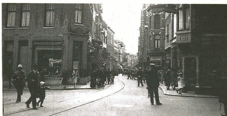
1925: Grote Houtstraat verandert al weer.