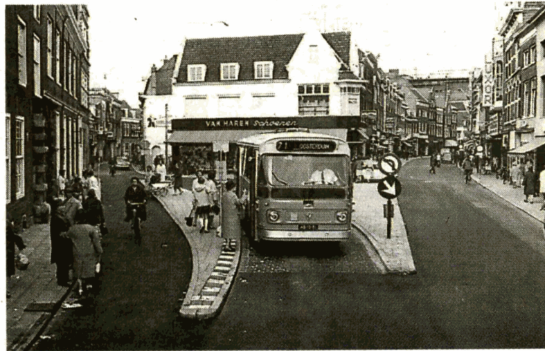
1966: NZH-bussen rijden nog door de Grote Houtstraat en Gierstraat.