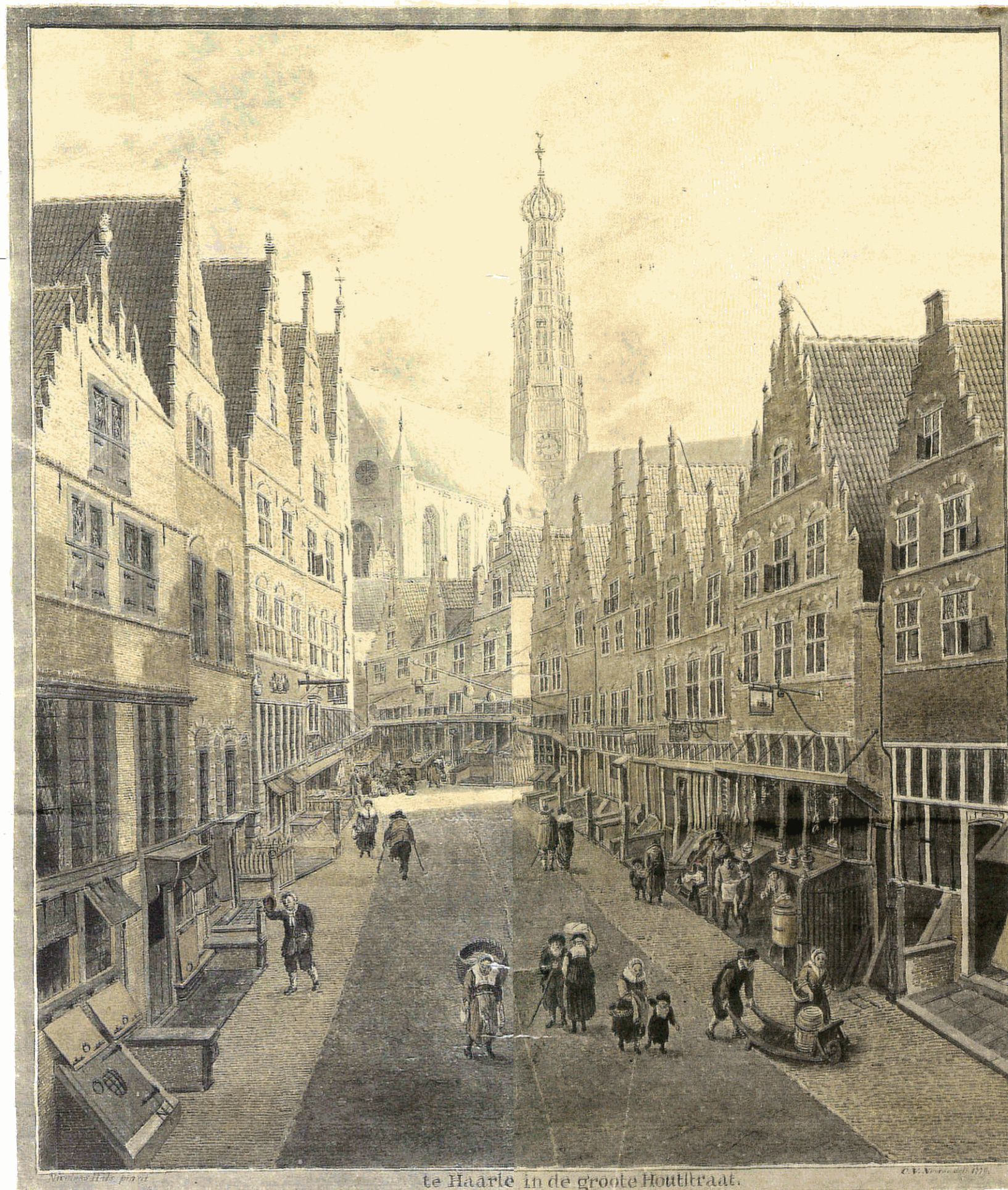
Tekening van Cornelis van Noorde, dat de Grote Houtstraat in de 17de eeuw laat i.

Het A4-tje vermeldt meer dan negentig beroepen die toen in de