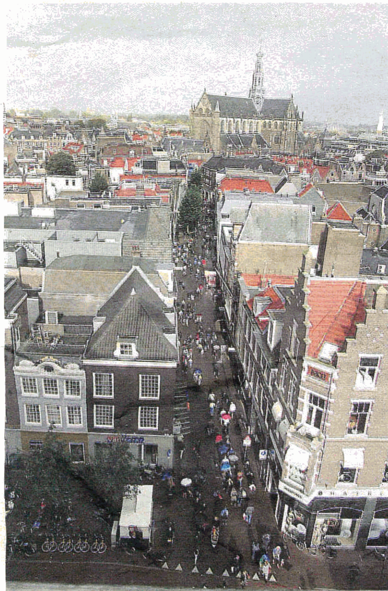
De Grote Houtstraat in de 21ste eeuw.