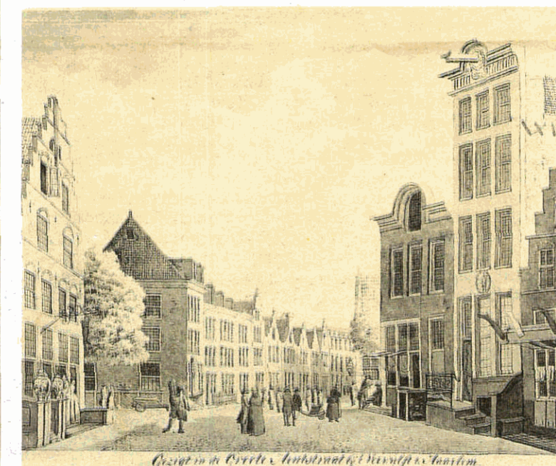
De kousenwinkel rechts op deze tekening van Hendrik Tavenier verraadt het winkelkarakter van de Grote Houtstraat in 1785. Links de laarzenmaker.