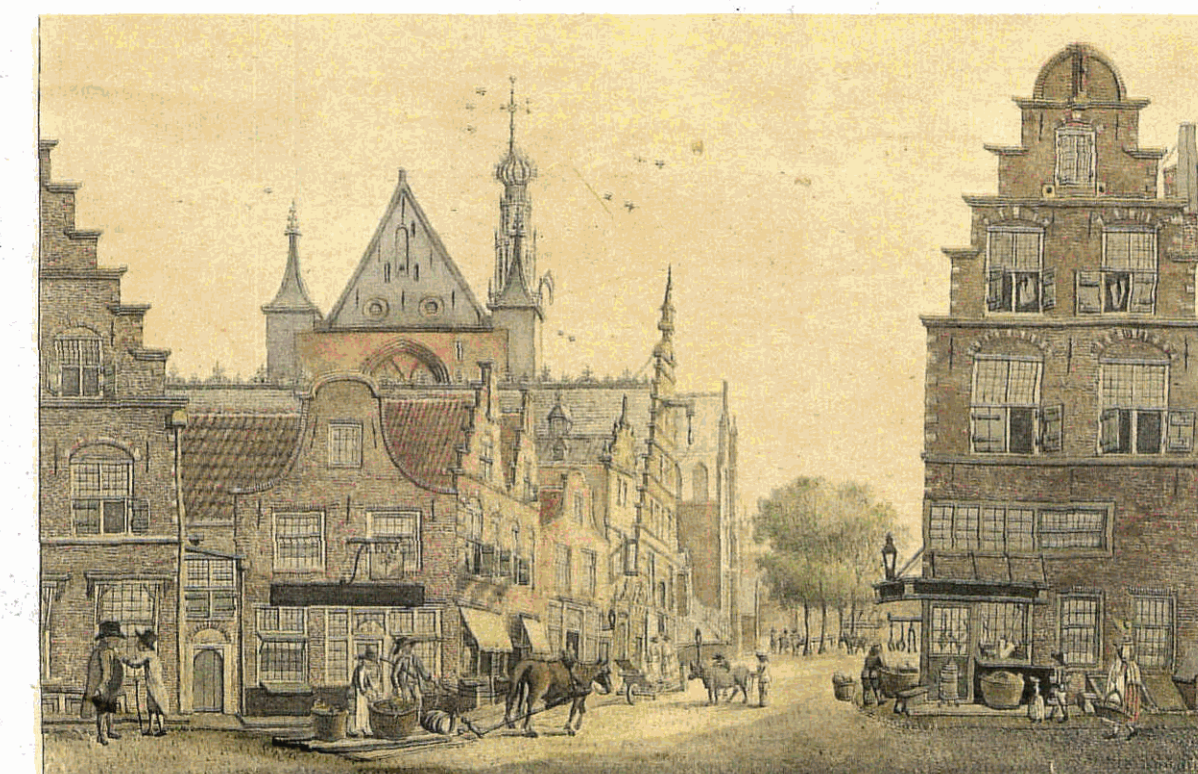
De winkelstraat ter hoogte van de Spekstraat eind 18de eeuw, tekening van Jan Pannebakker.