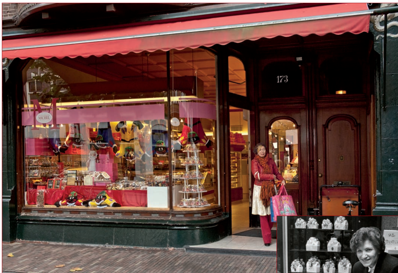
Het pand Grote Houtstraat 173, een eeuw na de oplevering.