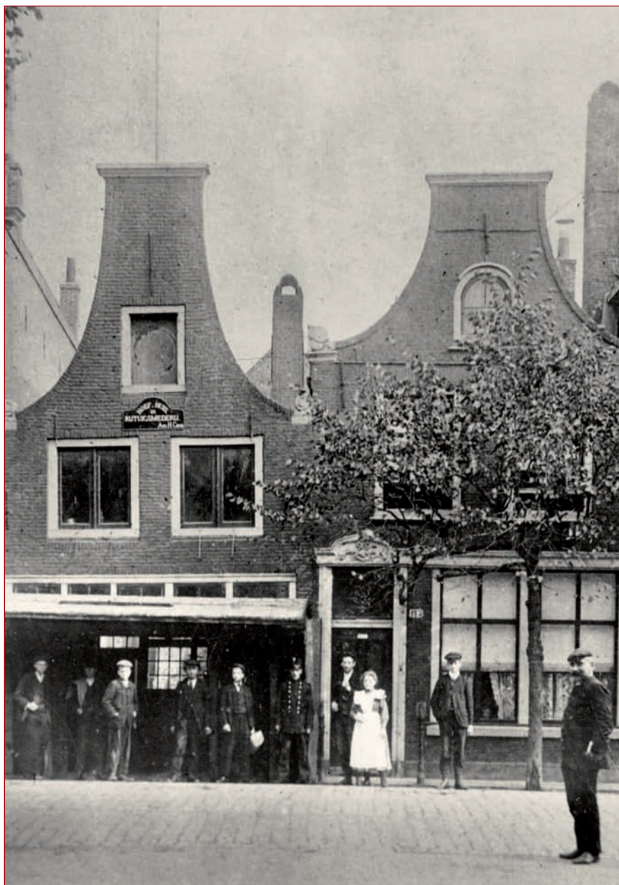
Rond 1870 stond er op nummer 173 in de Grote Houtstraat een smederij.