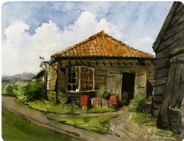
Links: Tekening van herberg Het Wapen van Amsterdam, Pieter van Loo (1768).

af, kwade jongen, als je durft.' Voor dit akkefietje moest Prévinaire zich voor de Haarlemse rechter verdedigen. Hij moest 200 gulden boete betalen en kreeg drie maanden gevangenisstraf. IV