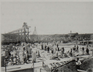
Pieter Oosterhuis, Werkzaamheden aan de Oranjesluizen, juni 1870

zou er slechts een sobere openingsplechtigheid plaatsvinden. Het totale project bestond uit het aanleggen van een kanaal met sluisen, een haven bij IJmuiden, een stoomgemaal bij Amsterdam, droogmakerijen in het IJ en het Wukermeer, en een aantal bruggen. De eerste fase bestond uit het doorgraven van zes kilometer duingebied. Dit gebeurde met behulp van een primitieve stoomgraafmachine, bijgenaamd 'de ijzeren man'. Het zand moest met kruiwagens worden weggehaald. Ruim duizend arbeiders werden aangetrokken om de graafwerkzaamheden voor het kanaal te verrichten. Bij Velsen Noord, bij de buitenplaats Wijkeroog, richtte men een betonfabriek op voor de vervaardiging van grote betonblokken voor de bouw van de pieren in de Noordzee, die beschutting zouden moeten bieden aan schepen van en naar het kanaal. Voor het vervoer van de blokken legde men een spoorrail aan. Steigers werden opgericht voor het lossen van de blokken. Engelse werknemers werden ingezet voor de betonfabriek en de bouw van de pieren. Voor de graafwerkzaamheden werden ongeschoolde Nederlandse grondwerkers aangeworven. Deze werkten 12 tot 16 uur per dag en kregen niet per uur, maar voor het aantal kubieke meters graafwerk uitbetaald. Voor huisvesting was niet gezorgd. De kanaalgravers leefden in