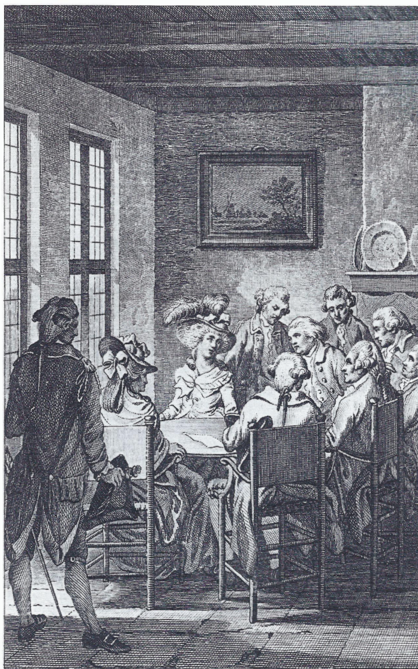
Onderhoud met haare K. HOOGHEID aan de Goejanverwelle Sluis.