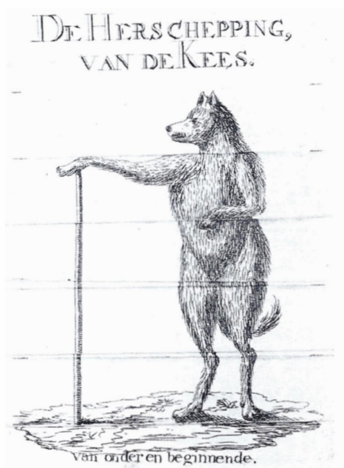
Afb. 3 Spotprent van een patriot.